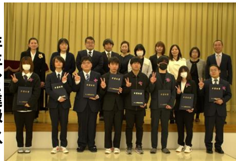
保護者の皆さんと11月30日、宇佐キャンパスで